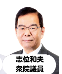
志位和夫 衆院議員